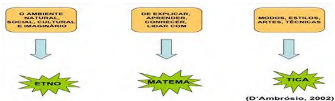
Fig. 1. O que é Etnomatemática?

O termo Etnomatemática surgiu na década de 70, na tentativa de aproximar o ensino da Matemática à realidade sociocultural dos estudantes e, ao mesmo tempo, para sanar as críticas sociais referentes ao ensino tradicional do referido componente curricular. D'Ambrósio (2008) afirma que, Etnomatemática retorque a raízes de uma cultura, portanto o objetivo da Etnomatemática é constatar e compreender as especificidades culturais de dado povo. Além de buscar esse resgate cultural das várias matemáticas existentes, não se deve vincular a etnomatemática apenas ao passado, o programa etnomatemática está presente na atualidade. A evolução constante das tecnologias da informação e comunicação as (TIC'S) exige cada vez mais vincular o saber matemático as novas culturas tecnológicas.