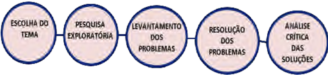
Fig. 3. Dinâmica da Modelagem Matemática na visão de Kluber e Burak

Percebe-se, conforme Kluber e Burak (2008), que nessas etapas propostas o trabalho sempre se realiza na interação entre professor-aluno-ambiente, no qual o professor deve ser o mediador do processo de ensino/aprendizagem do aluno e o ambiente é a fonte de toda a pesquisa exploratória.