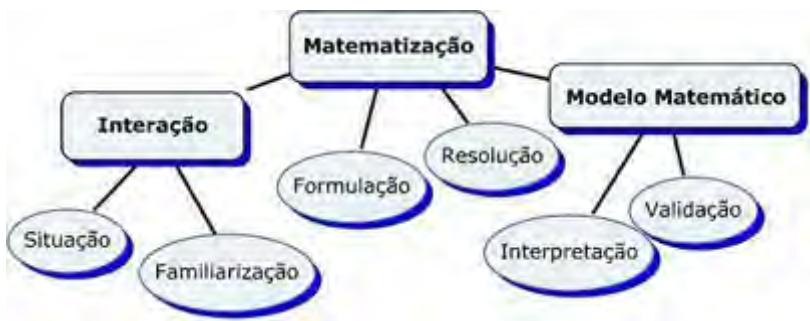
Fig. 2. Dinâmica da Modelagem Matemática

Isso significa que a Modelagem Matemática, além de método científico de pesquisa e estratégia de ensino, também pode ser entendida como metodologia de ensino específica da Matemática, conforme está demonstrado, logo abaixo, no esquema simplificado, contendo as etapas da Modelagem.